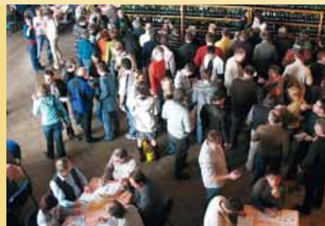
Podpora místních výstav a koštů se pro Vinařský fond stala již tradicí.