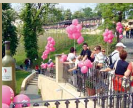
Svatováclavská vinice – Svátek růžových vín