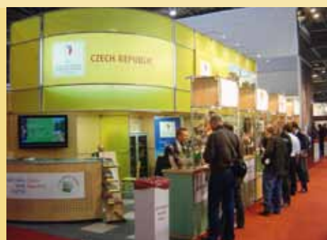
V roce 2009 se Česká republika poprvé prezentovala formou společného stánku vinařů na mezinárodním vinařském veletrhu v Londýně (LIWF).