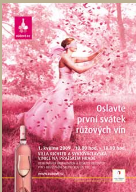
Vizuál kampaně na podporu prodeje růžových vín.