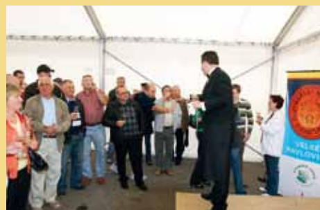
Rok 2009 byl ve znamení zvýšené podpory regionálních vinařských akcí – řada organizátorů vinobraní tak např. mohla rozšířit vinařské aktivity (zde řízená degustace na Velkopavlovickém vinobraní).

4. enogastronomická přehlídka – ryby a víno (Prachatice), 6. národní přehlídka – sýry a víno (Prachatice), Den v růžovém Rosé Coeli (Dolní Kounice), Festwine 2009 (Brno), Jarovín Rosé 2009 (Dobšice), Místní vinařský spolek Moravín (Mikulov), Neuburské – tajemná odrůda moravských vinic (Boleradice), Nominační výstava vín slovácké vinařské podoblasti (Kyjov), Pardubický festival vína (Pardubice), Svátky jara v Paříži (Asociace sommeliérů ČR), Valtické vinné trhy (Valtice), Vinař roku (Dobřichovice), Vinum Juvenale 2008 (Brno), Výstava vín šampiónů 2009 (Mikulov), Winefest 2009 (Mělník)