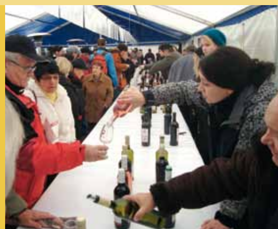
Návštěvnost na Svatomartinských koštech v Brně a v Bratislavě byla v roce 2009 kolem 4000 lidí.