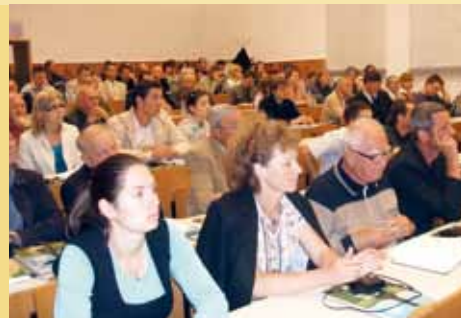
Účastníci konference k počtě profesora Krause na půdě MZLU v Lednici.